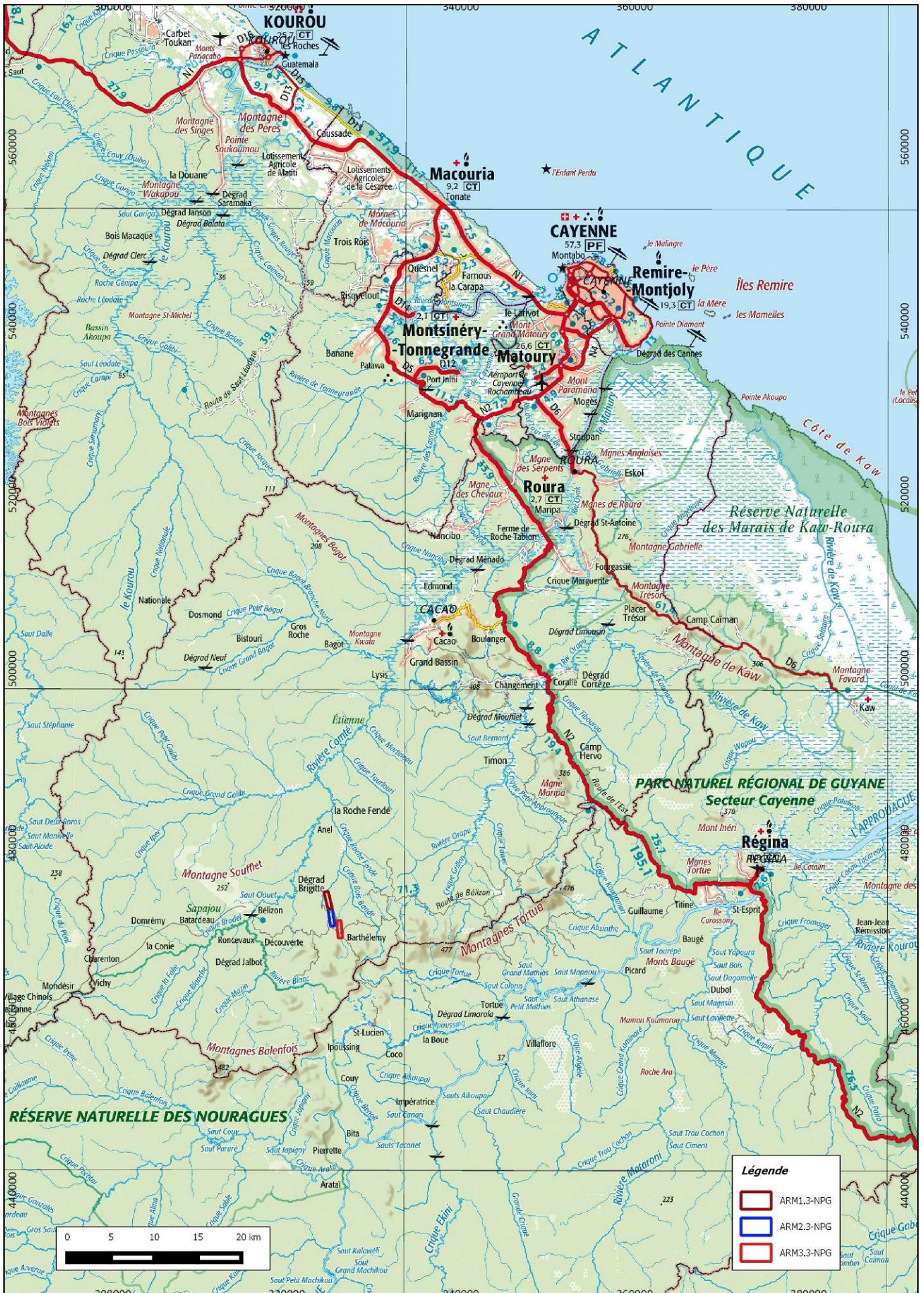
Annexe 2a : Plan de situation de l'ARM de 3km 2 demandée par NPG d'après la carte IGN au 1/500 000° en RGFG95, UTM22